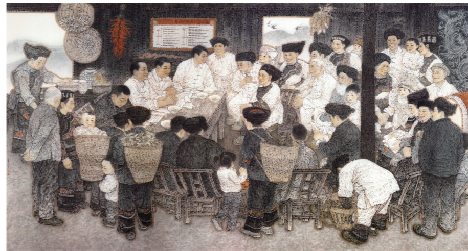
1. 王奋英，《暖心—十八洞村贫困户精准识别公示会》，国画，240×450cm，2019

文艺在塑造人民的精神世界，启迪人民的思想中发挥着重要作用。早在“五四”时期，面对形形色色的社会思潮，梁启超便