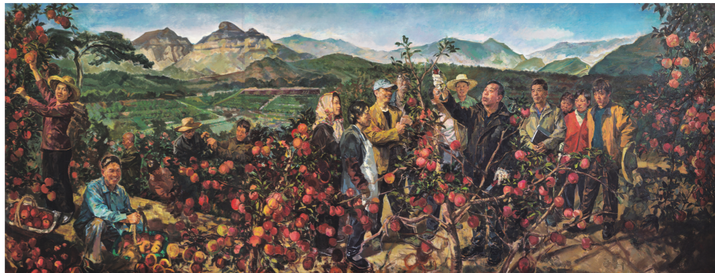
3. 郭健谦、褚朱炯、井士剑,《太行山上的新愚公》,油画,300×800cm,2017

在《太行山上的新愚公——李保国》中,画面以李保国在苹果园中向村民传授苹果的剪枝技术为表现的主体。在构图中,李保国剪枝示范的动作形成了画面的中心点,作品中的人物都将目光投向李保国手上的动作,专注认真地学习。蹲在地上的农民手提着满满丰收的篮子,与他脸上的笑容交相呼