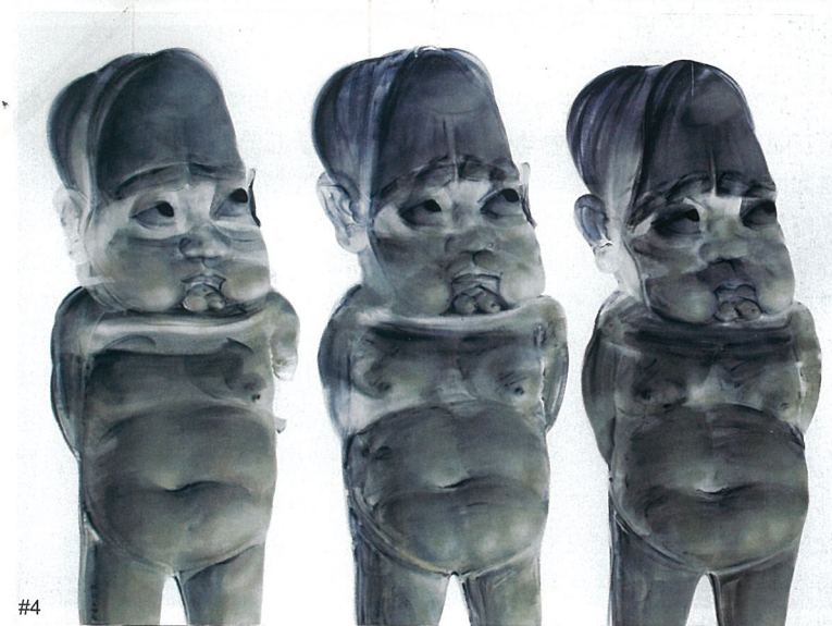
#1 无题 油画 杨劲松 #2 后花园记 油画 王朝刚 #3 无题 油画 王永成 #4 Nothing 丙烯 郑力