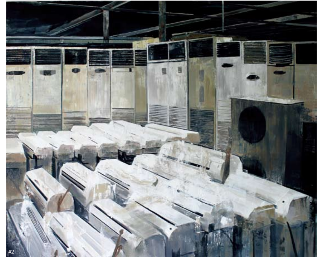
2 游迪文 矩系列NO.3 布面油画 170×205cm 2015

性，是不是个人的趣味能决定，这就在于来推动这个事情的人。我2006年和今年两次来参与罗中立奖学金评选，算是有始有终。我觉得罗中立奖学金是一个平台，也是一个渠道。所谓的渠道就是说通过这个奖学金把全国、亚洲甚至世界的美术馆、艺术机构带到川美来，携带了一些信息。作为一个平台来说，这里不光是川美的毕业生，甚至是全国十大美院的毕业生，其他艺术学院的学生都可以在这个平台进行交流。重庆这个地方还是相对偏僻一些，所以这些信息就显得特别有价值。在我2006年来的时候，从参与的学生和作品来看其实还是以川美的学生为主，其他院校的学生没那么多。今年我作为初评的评委，看到了所有参赛的作品，我发现它作为一个奖学金已经非常广泛。我评完以后有一个概念，我想要是中国的年轻画家就这样画下去，这样做下去，中国的艺术要是不好都难。因为每个人都找到自己的点，进行深入的研究和探索，这是不得了的。