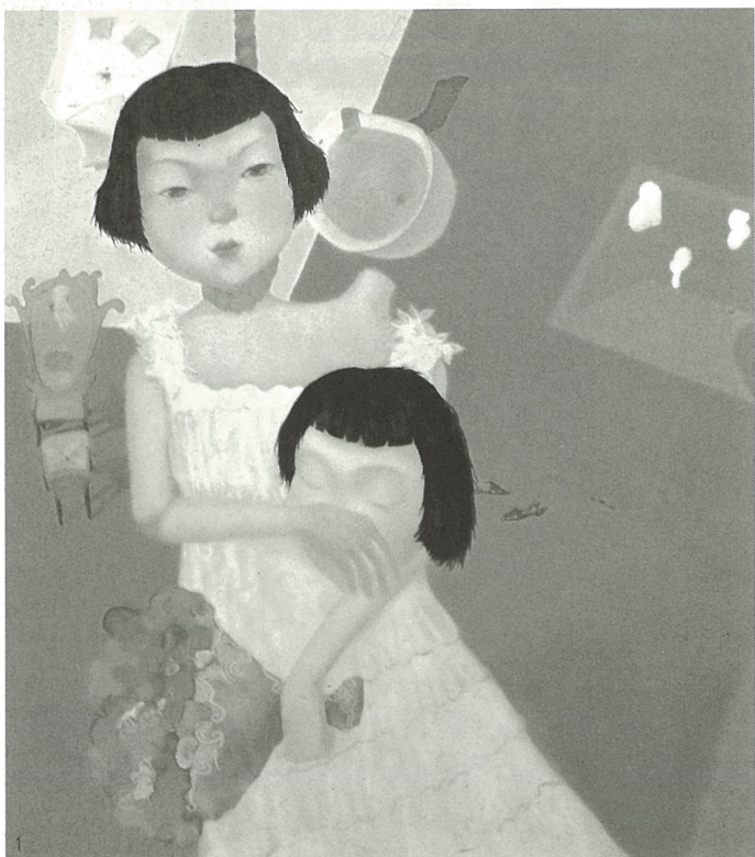
1. 高处的静 油画 杜文雯

都说重庆的夏天是火炉,我看川美毕业展油画展区的热度更盛。在国内油画市场一派大好的背景下,画商和画坛“星探”开始关注川美在校生的毕业展,不少学生的毕业创作以成千上万的不菲价格成交。皆大欢喜的结果成为展场内外的焦点话题,这是好事。想想以前,画家们一样饥饿,见面就问“吃了没有”,现在如雨后春笋般的画家们也可理直气壮地问声“卖了没有”。从“吃了没有”到“卖了没有”是社会的进步,虽说不一定是艺术的福音,却肯定是艺术家的福音。比“卖了没有”更吸引人的当数“签了没有”,毫无疑问,当不分配工作以后,能与画廊签约而衣食无忧差不多成了铁饭碗的代名词。于是在展览中或者其后不久,总能听到某人被签、某人卖了几幅画等振奋人心的消息,我也提醒学生们在作品标签上注明联系电话以免坐失良机。没有办法,学生也要吃饭穿衣,看看我们的毕业生怎么生活的,就能感受到毕业展的热闹是多么重要。少数画得较好的同学签约或卖了画能