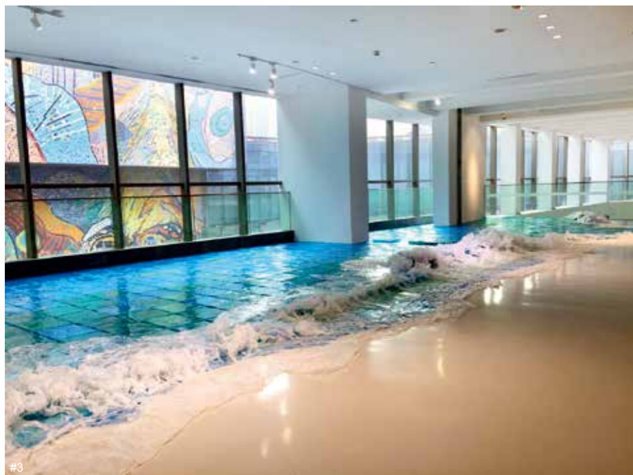
3 有金小组（张有魁&金善珍） sea 塑料 尺寸可变 2019

式，那么过去的就代表要被否定或者取消吗？我不这么认为，我们依然需要这样的人群继承传统。但是民间艺人存在的思维短板在于他们痴迷于对现代事物的简单描摹，并且认为这样的方式具有当代性。这不排除受群体意识影响的嫌疑，当一个群体受到另外一种不一样力量的刺激后，会产生自我怀疑，最终将简单的结合作为自己具有当代性的理由。因而在“继承”这件事情上并不能做得很好，却把精力时间耗费在拙劣而简单的嫁接上。