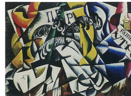
来自代尔商店的物品 布面油画 里尤波夫·波波娃