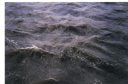
静止的水 摄影 罗妮·霍恩

2009年2月25日英国泰特现代美术馆将举行名为“罗妮·霍恩又叫罗妮·霍恩”的展览。美国艺术家罗妮·霍恩通常被看作是雕塑家，这次展览展示了艺术家影像、装置、大量的绘画，手稿和早期的水彩作品等力图从全面的角度展示艺术家自1975年至今对各种艺术材料的尝试，是艺术家迄今为止作品最全面的展示。从1975年开始霍恩就开始经常去冰岛旅游，冰岛的与世隔绝的环境对艺术家的创作产生了深远的影响。同时她的作品也为世人展现了冰岛在环境和地质上的变化。本次展览将于5月25日结束。