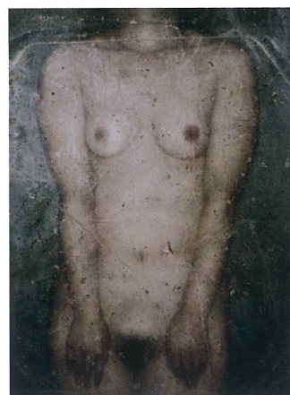
物语-水空气和身体 布面油画 石冲

由鲁虹、刘宇策划的“互动”2008中国当代油画邀请展于2008年12月26日至2009年2月26日在武汉美术馆举行。此次展览由武汉籍以及曾经生活工作在武汉的41位艺术家组成。“互动——2008中国油画邀请展”是这次四个开馆展的重点展，策展时间达一年多。展览之所以被命名为“互动”，因其明确强调了参展艺术家之间的良性互动关系。这次展览的艺术家，无论从地域上还是从年龄的跨度上来讲都是相当大的，也正是基于这一点，艺术家们的交流和互动才更具意义。