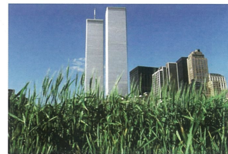
安吉丽丝·丹尼斯作品

2009年1月19日美国惠特尼美术馆将举行名为“场地”的展览。在战后一段时期，传统艺术观念正改变着我们的环境，居所和场地。正如批评家哈罗德·劳什伯格描述绘画一样“它是一个表演的舞台”。自1950年来艺术家不断在阐释着这样一个观念。但在当代艺术