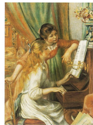
内耶尔·奥古斯特·雷诺阿作品

2009年1月21日至2009年4月26日，在美国大都会美术馆的2楼将举办简·勃纳的作品收藏展，此次展览将是首批瑞士日内瓦简·勃纳先生经典收藏的欧洲大师及19世纪绘画作品的综合展览，展览将展出文艺复兴时期到1900年的120幅绘画作品，跨越艺术历史500年之久，展现了意大利、北欧、法国、英国及其他国家的多种艺术形式。展览的作品囊括了诸多世界大师，如拉斐尔，伦勃朗，夏尔丹，戈雅，安格尔，德拉克洛瓦，马奈，惠斯勒，德加，塞尚，雷诺阿，高更，凡高。当然也有一些鲜为人知的艺术家的作品。