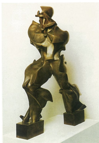
乌姆伯长·波丘尼作品

2009年2月11日美国纽约现代艺术馆将举办题为词汇的自由，未来主义100年。100年前诗人兼作家的F·T·马里·蒂提出了第一个未来主义的主张。此次展览，以文献呈现为主，将展出包括运动宣言，批评家文章，相关杂志和书籍。展览主要是为了探讨运动本身的美学意义和运动本身对政治的关注。展览将于4月6日结束。