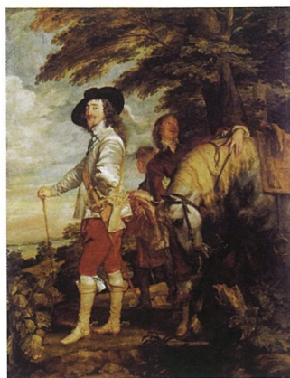
查理一世 布面油画 凡·戴克

2009年2月18日泰特英国美术馆将举行名为“凡·戴克与英国”凡·戴克作品展。凡·戴克是英国十七世纪最伟大的艺术家。他出生和受教育于当时的艺术中心，比利时安特卫普城，后移居英国。凡·戴克一身与英国结下了不解的情缘，他与英国宫廷有着千丝万缕的联系。本次展览将展出他在英国期间创作的作品。展览将持续到5月17日