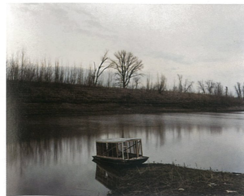
圣吉纳维芙 摄影 艾克·索斯

2009年1月20日美国纽约高古轩画廊举办名为“w的最后一天”艾克·索斯摄影作品展。这次展出的作品是从2000年至2008年，在乔治·W·布什出任总统期间创作的。展览并不是出于政治迎合的目的，而是为了揭示出一个国家被它悲惨的领导阶级的能力耗尽的全景。艺术家的作品反映了在国家管理的反作用下社会被扭曲。此次展览也正好讽刺了布什在2000年说的“我想我们应该同意，过去即将结束。展览将持续到3月7日。