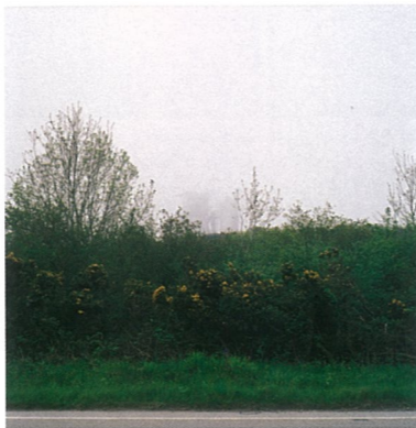
无题 摄影 保罗·格拉汉姆

2009年2月4日至5月18日美国纽约现代美术馆将举行名为“希望的闪光”保罗·格拉汉姆摄影作品展。保罗·格拉汉姆出生于英国，2002年移居到美国，并在随后环绕美国的旅途中制作了大量的作品，他的作品试图捕捉那些无法用言语去描述的瞬间。该展览展示的作品是从艺术家已出版的共十二册名为《希望的闪光》的作品集中精选出来的。