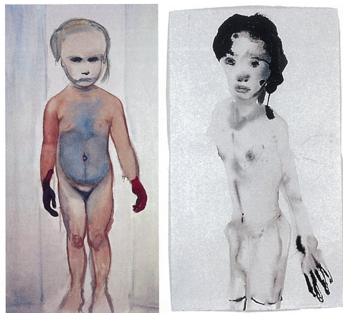
艺术家斯 油画 玛琳·杜玛斯 年轻男孩 油画 玛琳·杜玛斯