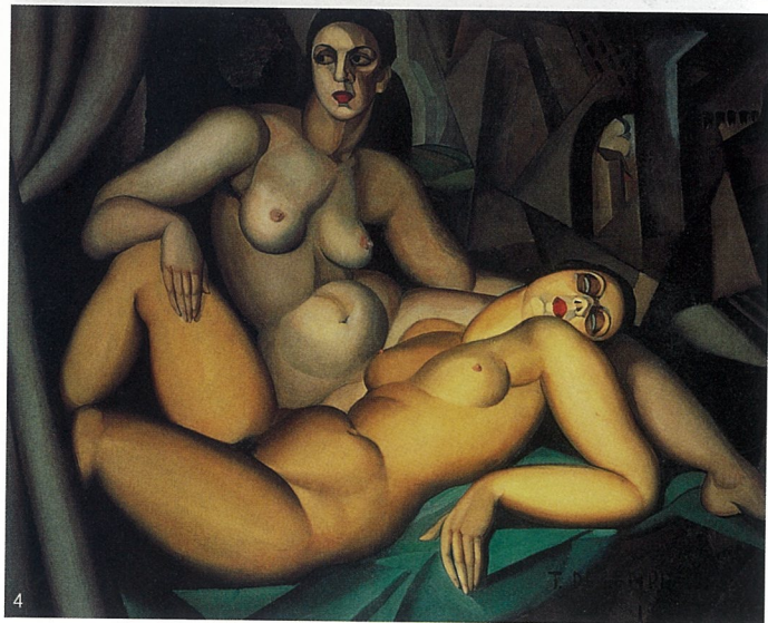
1-4. 无题 油画 塔玛拉·德·朗皮卡