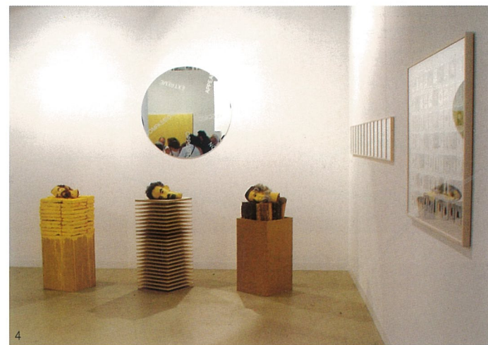
1-3, 第37届巴塞尔艺术博览会“艺术无限”单元展出作品 4, 第37届巴塞尔艺术博览会展出作品

问题，是全球范围内存在的。但中国或许还不像国外的美术馆、艺术机构面对的问题那么严峻：一是因为我们的美术馆机制还不规范，二是我们也穷惯了。但我们这次来巴塞尔，表面上看是负担了沉重的经济支出，但实际上，我们一方面扩大了上海美术馆的影响力；另一方面，也找寻到了合作的机会。实际上是走了一个捷径。把这笔费用分摊在媒体宣传和我们联系的展览中去，实际上成本投入已经很合算了。