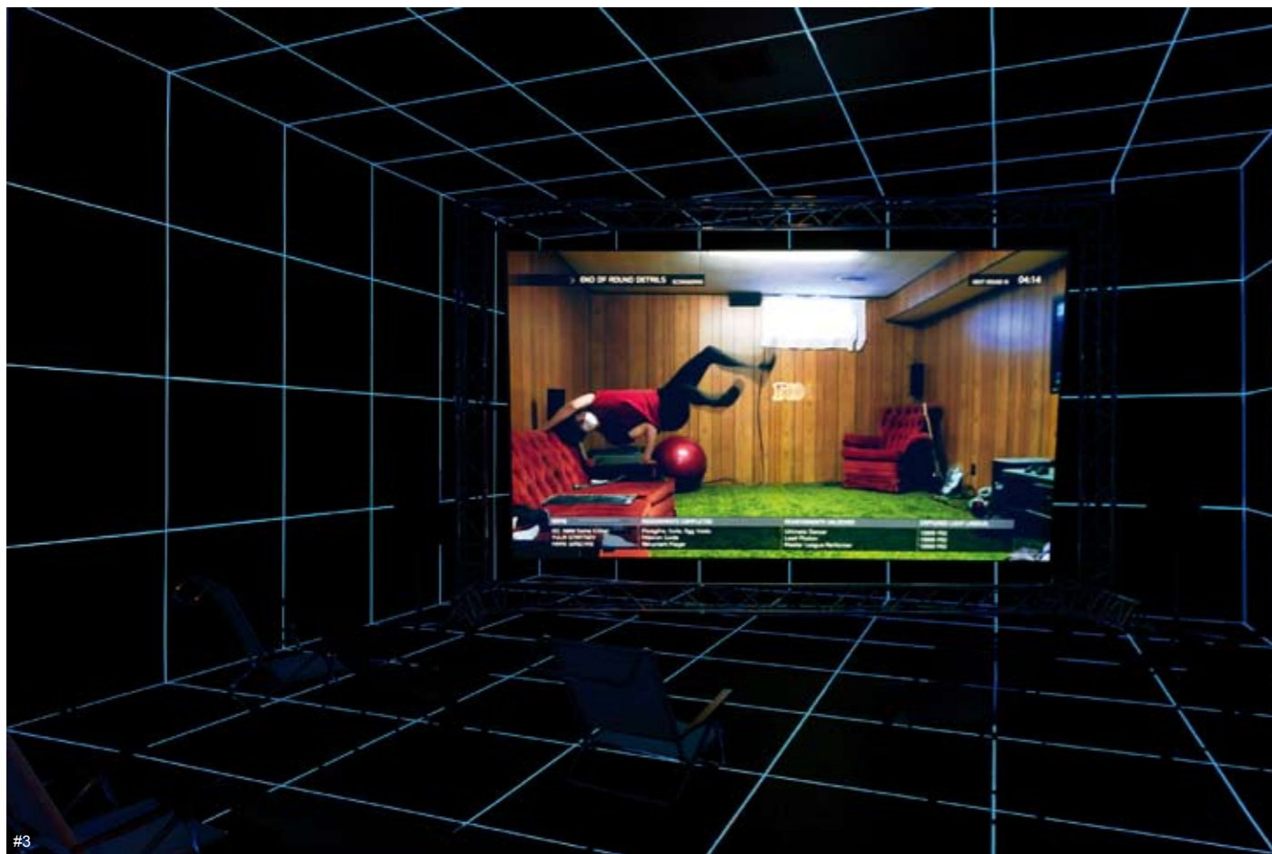
3 黑特·史德耶尔 (Hito Steyerl) 太阳工厂 2015