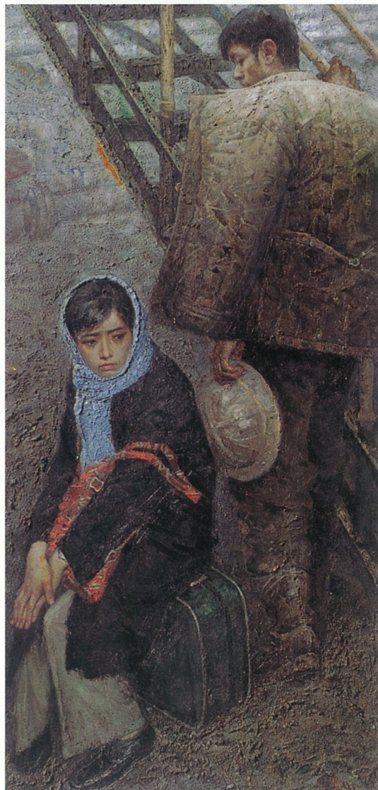
我爱油田(油画) 高小华