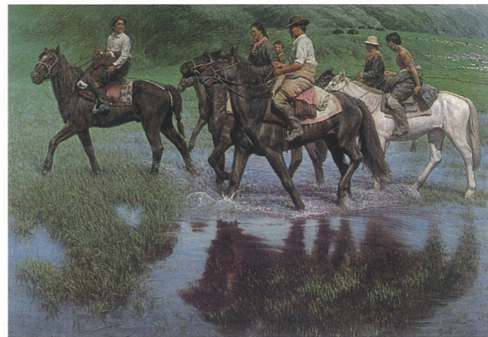
踏波行(油画) 张方震

党委要管好党员、管好党支部。充分发挥党组织的战斗堡垒作用和党员的先锋模范作用。认真做好思想政治工作，关心师生员工的切身实际问题。同时正确处理好党政领导关系。党委不包揽行政事务工作，在重大问题上把关，充分发挥行政各级班子的作用。为把美院办成世界一流的学校，为培养出适应二十一世纪美术教育需要的新人才，共同协作出力，创作出新时代符合人民需要的优秀美术作品而共同努力奋斗！（作者系原党委书记）