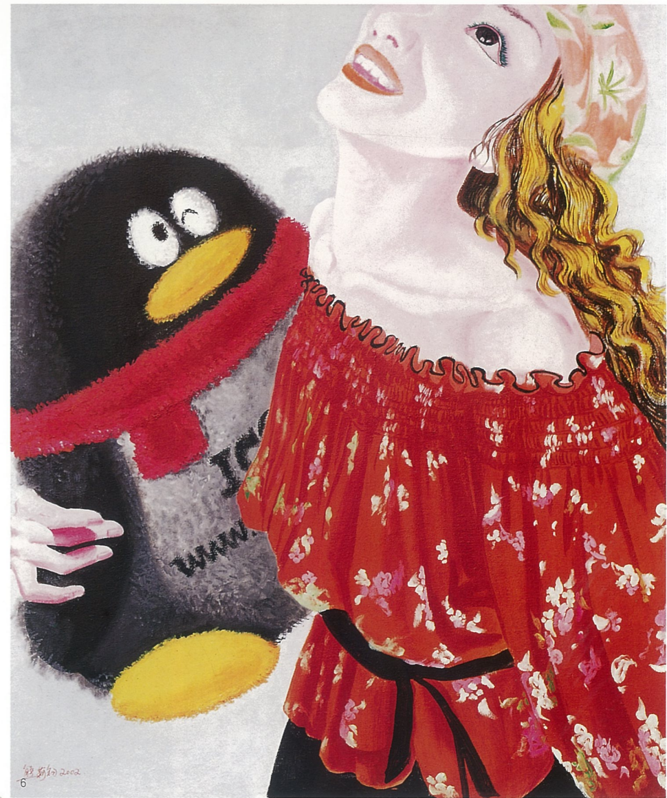
1. 另类肤浅 NO.8 油画 熊莉钧 2. 另类肤浅 NO.4 油画 熊莉钧 3. 波希米亚风 NO.4 油画 熊莉钧 4. 另类肤浅 NO.7 油画 熊莉钧 5. 波希米亚风 NO.2 油画 熊莉钧 6. 另类肤浅 NO.1 油画 熊莉钧