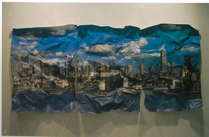
1、局部解剖的风景(日落) 装置 杰斯·大卫拉 2-3、不生产的机器 装置 杰斯·大卫拉 4、局部解剖的风景(纽约) 装置 杰斯·大卫拉