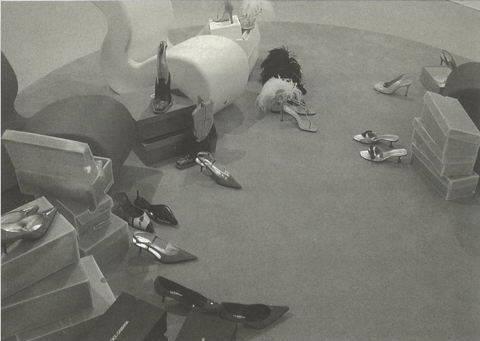
无题 装置 西尔维·弗勒里