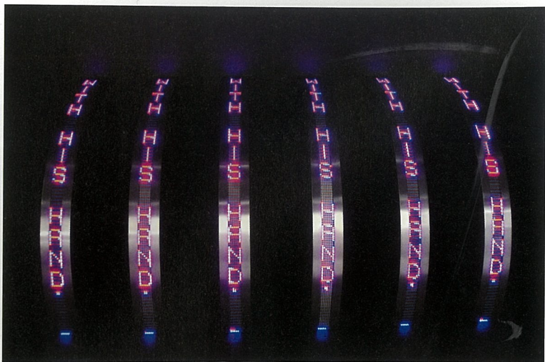
第42届巴塞尔艺术博览会展览现场

他能够熟练这套方法以后再创造出自己的方法。那么，当代艺术教育的生命力就不再是传统的“鱼”，“渔”虽重要但也不能够只是“渔”，而关键是要使艺术家形成自己的观念和理念。这也是艺术教育的最终目的。这又体现了实验艺术教学中“实验”二字的重要性。能够在实验和练习过程中得出艺术作品的观念和理念这是一条可行之路。在这个实验的过程中，或者说，由“渔”过渡到下个阶段，即创作阶段，我们往往忽略了这个过渡段需要的必要条件，就是对艺术理论知识的构建。实验艺术教学若真要成为一个合理、科学的体系，就应当涉及到对艺术家的教育中教学项目分配中理论知识的培养。虽然，现在各大艺术院校均给艺术生开设了美术史课程，但是作为公共课的美术史课程量少，传授也太局限、太狭隘。很多学生到了毕业才认识到理论知识的重要性，尤其是学国画、油画、版画、雕塑的学生和青年艺术家。从现在艺术发展状况来说，各艺术媒介之间的界限越来越模糊，架上绘画逐渐走向影像和装置。于是各大院校都在强调培养综合性的人才，使其更多的接触最前沿的艺术方式。而现在中国当代艺术前沿的艺术方式就是影像和装置。事实上，影像、装置仍然可以说是一种外在形式，一种艺术技法，它的技法就是要掌控多媒体、材料等。那么这种培养仍然还是技法基础的培养，只不过是传统的技法的升级版而已。这个时候理论知识的注入就显得尤为重要了。如果我们把艺术的媒介当成一种语言性的系统，辅以理论系统的支持，那么它很有可能成为一个学术系统。所以，当代艺术教育需要培养的综合型人才，理论系统的教育是不能规避的。