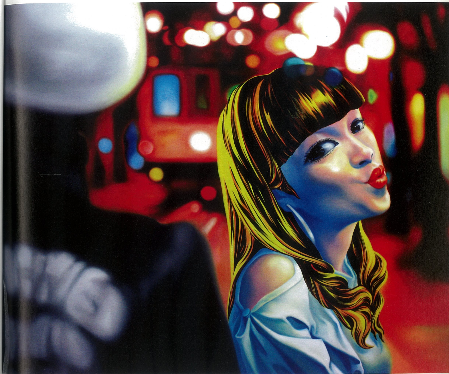
我们 布面丙烯 120×150cm 2011年 熊莉钧

现在的教育方式、现代人可能都太过浮躁，忽略了关于理论建设和文化底蕴的培养。新型的实验艺术教学也许能够解决许多问题，但对待艺术当代教育，现在我们需要重新加以配餐，使当代艺术教育更为健康的发展。