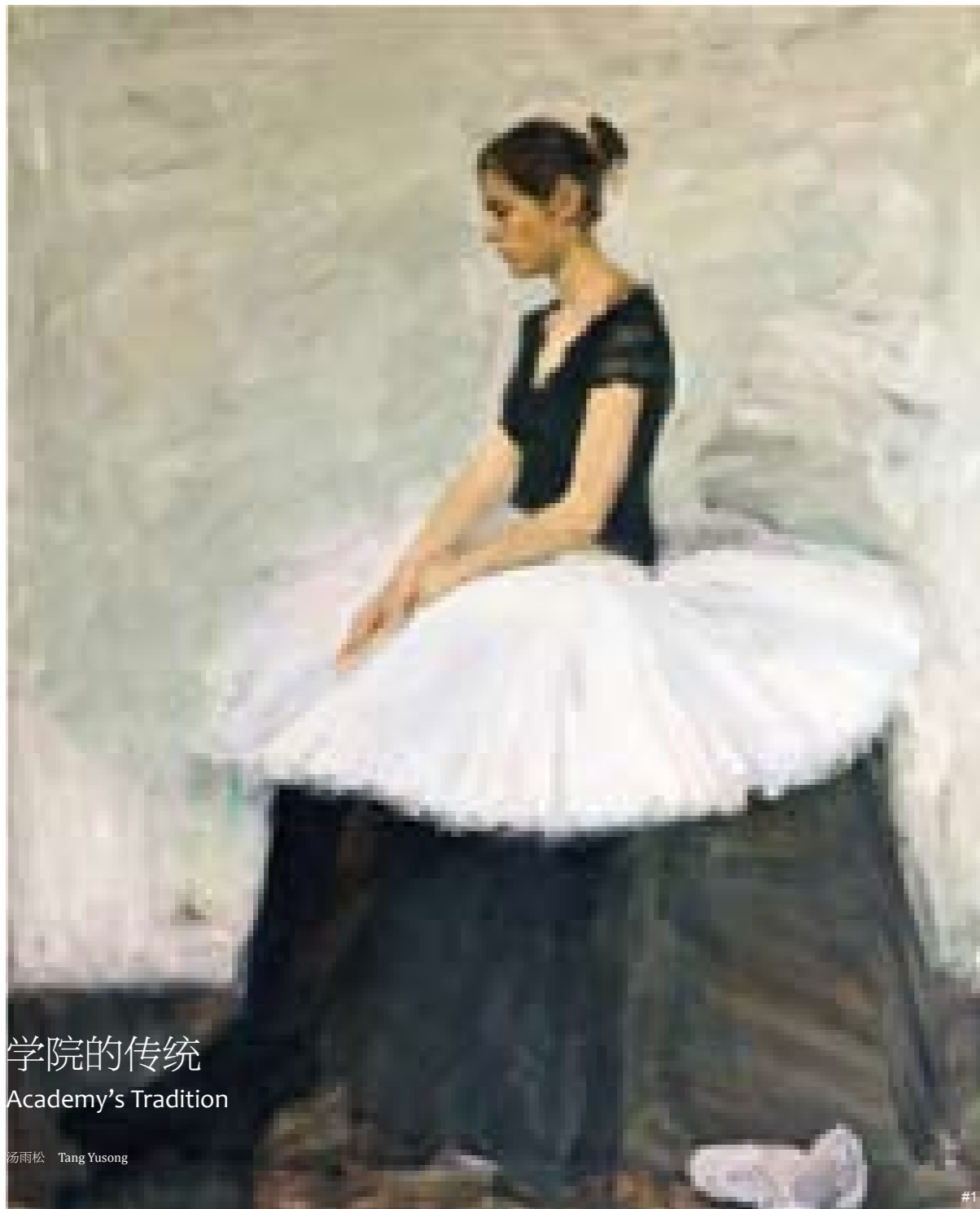
学院的传统 Academy's Tradition