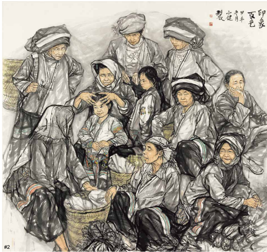
2 陈小健 印象百色 200cm×200cm

方文化的长处，从农村入手，以交易和合作为手段，以知识分子和农民为动力，创造新文化，在政治、经济上开出一条新的现代化道路来。他毅然带领大批知识分子来到农村进行社会改造实验，先广东，后河南，再山东，从“乡治”到“村治”，再到乡村建设。