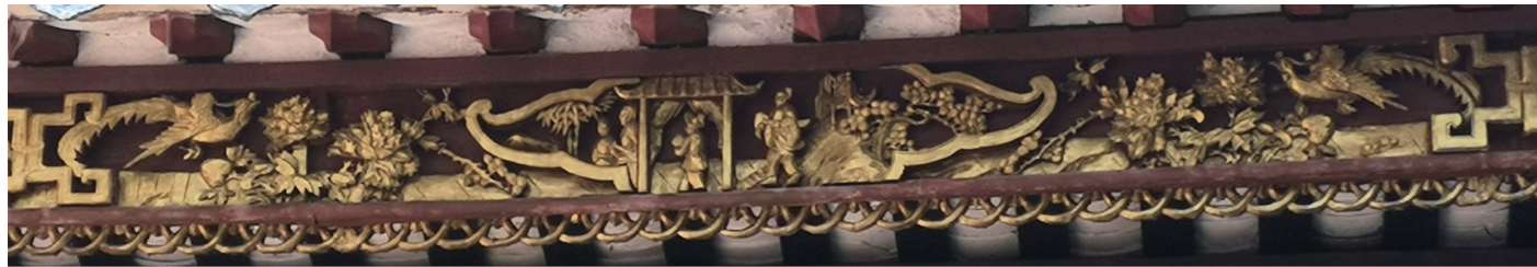
5.《山门封檐板金漆木雕》，摄影：王颖，2020

数据内容，这样能够有效适应表空间较大的更新频率，解决备份占据较大空间的问题。注意在备份时不能影响数据库的正常工作，同时需要妥善保存好备份文件 [30] 。