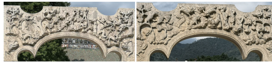
3.《牌坊门楼东侧拱门上方》(左右上角为喜上眉梢,左下为狮子滚球,右上为赵颜求寿,右下为麻姑献寿),摄影:王颖,2020 4.《牌坊门楼西侧拱门上方》(右上天官赐福,左为松鹤延年,右为喜鹊登科,正中为五子登科),摄影:王颖,2020

出性互动”即是数据库向浏览者输出,浏览者可在浏览中将想要的页面(包括图片、文献资料、影像等)直接输出到自己的手机端或邮箱。除此以外,互动性还包括娱乐部分。参考上海博物馆的做法,将数据库中的数据以知识问答、拼图和猜谜等方式与浏览者进行互动。考虑到我们的主体数据是“三雕两塑一壁画”,我们可以设计填色游戏和工艺制造游戏,让浏览者在自主设计并制造完成作品后,再为雕、塑和画上色,在完成一道道“工序”后还可以直接将作品分享到微信、微博等各大平台,这也是“输出”的一部分。增加娱乐环节不仅能激发浏览者对“三雕两塑一壁画”及其工艺技术的兴趣,而且能够让人们重新重视这些艺术作品以及工艺技术,有利于传统文化与技艺的传承。