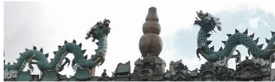
2.《灰塑:双龙护珠》,摄影:王颖,2020年

互动功能包括“输入性互动”和“输出性互动”两个环节。“输入性互动”即是浏览者向数据库输入,包括在每个分类版块最后的留言,让浏览者在线上交流互动;“输