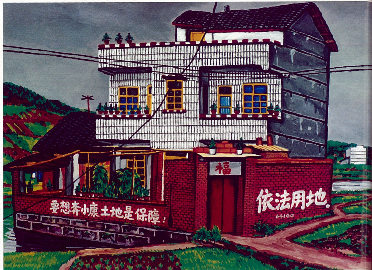
菜地边的房子 陈卫闽 布上油画