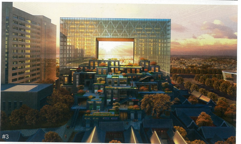
#1 同构 动画片 周宗凯、陶宇 #2 失落的文明 漫画插画 师涛 #3 宜南会馆 三维建筑动画 唐宏伟