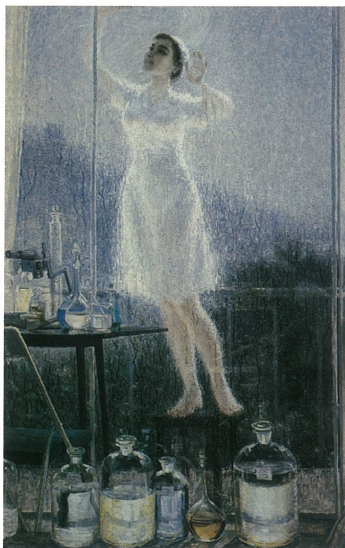
雨过天晴(油画) 王大同

改革开放带来的负面影响是物欲膨胀精神贫乏，儒道精神桎梏，使民族文化痼疾深沉。在这关键的十字路口。应当谋划艺术重新回归大众走真正代表先进文化方向之路。