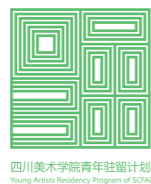
1 “弹出——四川美术学院青年艺术家驻留计划 2020—2021 终期汇报展”四川美术学院美术馆展览现场