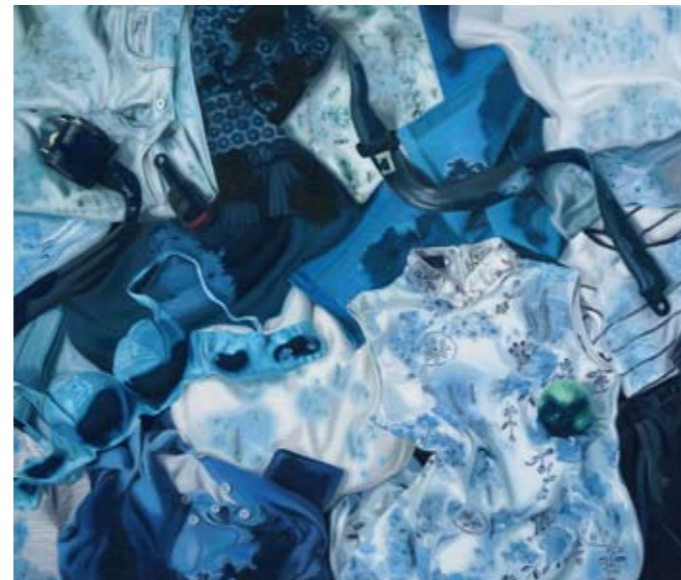
1 樊磊 室内游戏 布面油画 2016