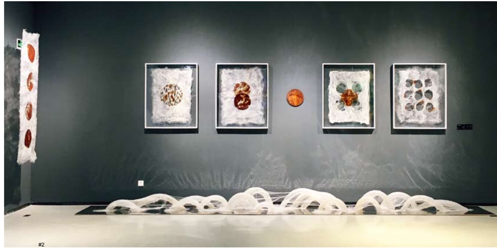
2 蒲柯宇 《缪兮缪兮》，《诗三首之归去来兮》 综合材料 蚕丝、铁锤、亚克力 2016

作品通过不同色域，展现了女性在各领域最原始的美。通过线条和块面分割，不断寻求新的发现，让作品以其独特的形式感和冲击力，采用单纯却不失趣味性的个体表达画面内容，寻找色彩之间、情感之间的平衡，使色彩和情感达到互补，女性在追求美的同时不要忘记安全性。如何把女性美和自身本来面目放在一个适当的位置？当生活的缺失和把握找不到一个平衡点时，我们应该怎么去找到一个突破口？美和自身的联系在哪个位置？我们到底应该是把我们本来的真面目呈现出来还是将自己融合在这个社会的各个环境里？这是我一直在思考的。