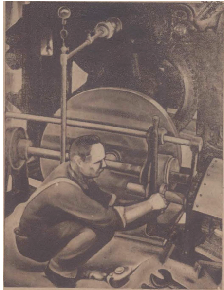
12. 周真太,《修机》,约1935,原作遗失