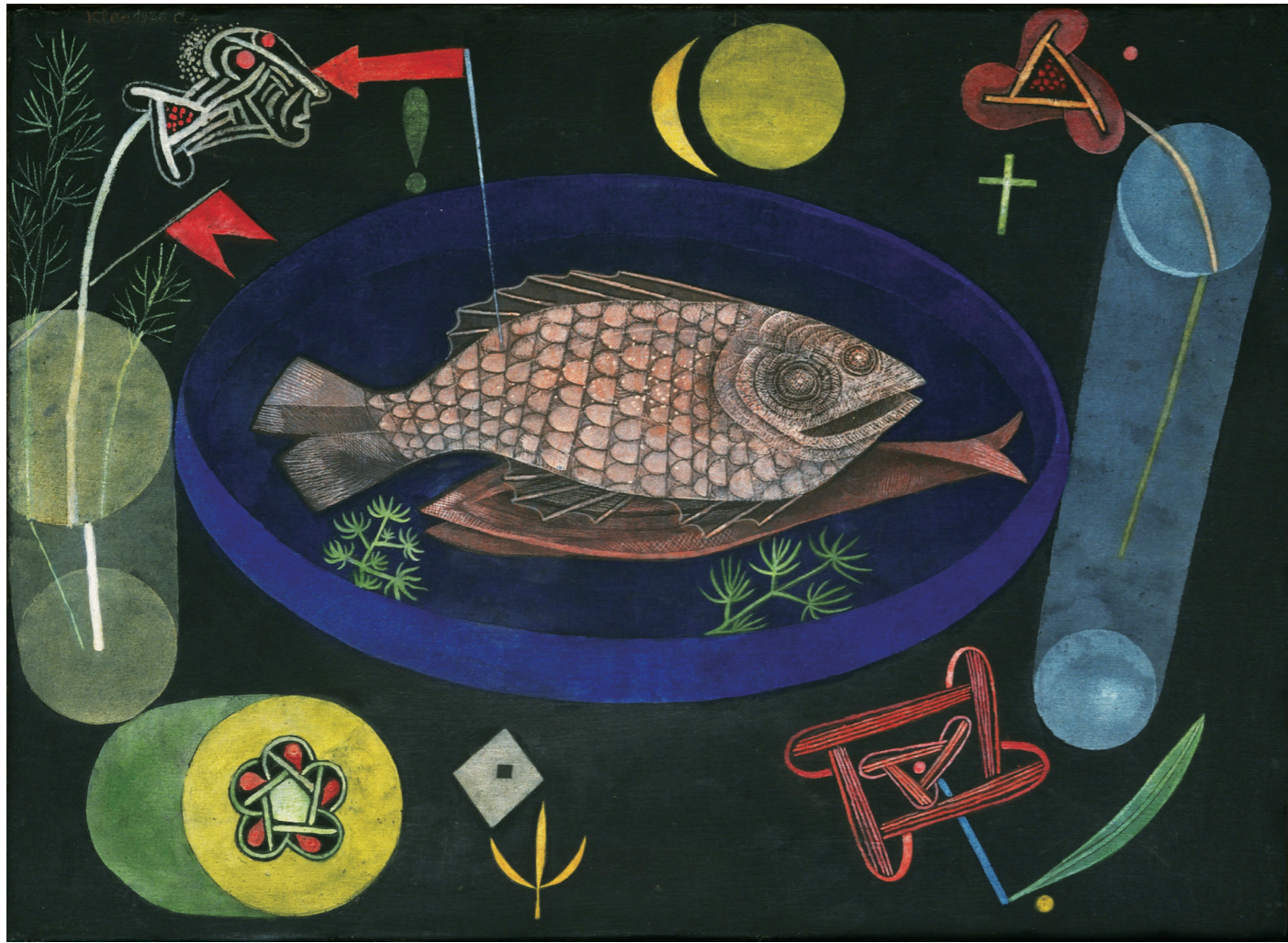
5. 保罗·克利，《鱼的周围》，布面油彩与坦培拉，46.7×63.8cm，1926，MoMA

薰蕕与段平右、周多三人在上海南京路上的大陆商场中国国货公司举行商业美术展，并获得《时代》画报的报道。这篇报道文字耐人寻味：“商业美术，国人素未注重，即从事业者亦忽焉不详……庞薰蕕、周多、段平右三位，因鉴于此，特于上海大陆商场举行商业美术展览，陈列合作广告数十点，均为欧美最新式之技术表演，惟对于东方之意味稍差，望有改之。” [16] 这评论点明大熊美术社的广告作品有新颖的西方现代艺术作风，但未能被本土消费者所接受。