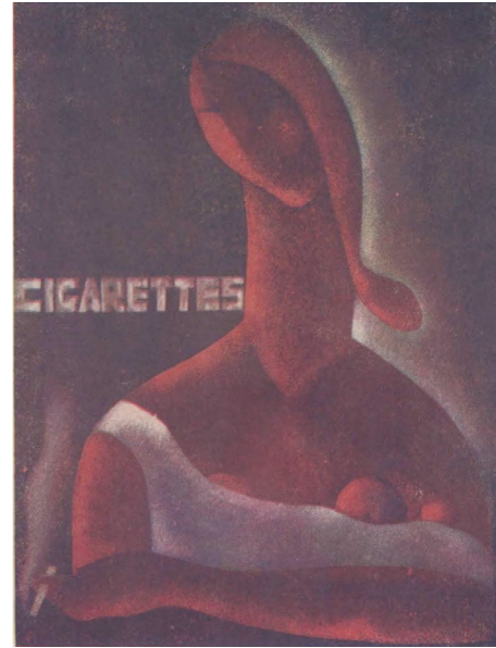
11. 大熊工商业美术社,商业美术展览会之《香烟》广告,1933

图形来表现互相交错的机械部件。1926年的水彩画《机械元素》又以圆盘、圆点、圆锥形直线和波浪线组成了纵向贯穿画面的机械设备局部特写。实际上,这就是机械设备设计图的抽象化版本。这种构图形式也被庞薰应用在了他的《构图》中,不过比莱热的更为具象。