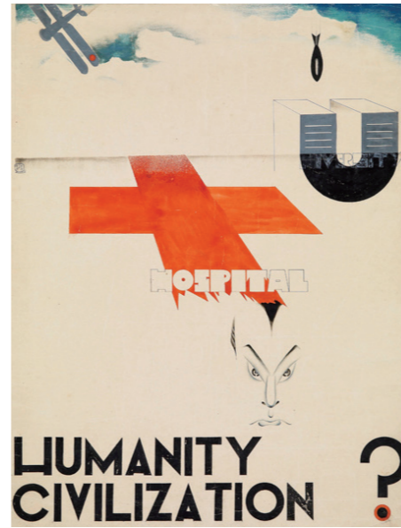
10. 庞薰,《这是人类的文明吗》,纸本水彩,72×56.5cm,1935,庞薰美术馆藏

画面左下方有位表情悲愁,罩着头巾的农妇,她身旁并立着一个青铜色机械人般的人物。在这两人右侧,体积远大于二人,自上而下纵向贯穿画面的是一台压榨机的剖面局部特写。二人背后一道高墙,将他们与左上方手拉手围成圈起舞的白衣少女们隔绝开。画面中最别出心裁的是上下呼应的两只大手,上方一只巨大的人手在压榨机最上部的手轮,下方的钢铁管道上露出一只粗大的机械手。首先从画面的形式上,这种纵贯画布的机械设备局部特写是莱热的拿手好戏。1918年开始,莱热进入“机械时代”,他的作品从形式到内容都与几何、机械密切相关。1920年他创作了富有装饰性的《机械元素》,抽象化地用不规则排布的各种几何