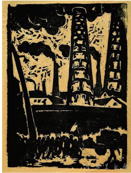
13. 叶洛(叶乃芬),《斗争》,木刻,17.5×12.9cm,1933,中国美术馆收藏

鉴,但无论对于庞薰琹还是莱热,形式的目的在于表达他们所经历的现代性,而两人作品中的现代性是完全不一样的。莱热的现代性在于几何、机械、科技、生气勃勃的现代都市、令人愉悦的装饰性。而庞薰琹透过画面讨论的问题是凝重的,他批判性地反映了当时初步进入现代社会的中国的一些深层困境。