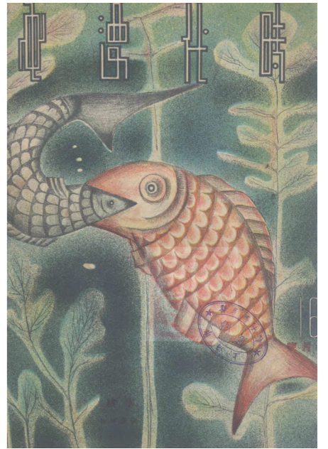
4. 庞薰琹，《水族》，《时代漫画》1935年第16期封面

时隔多年，庞薰琹仍然能在自传中清晰回忆“巴黎画派和其他一些新的艺术流派，多数集中在圆顶咖啡馆（La Coupole，位于巴黎蒙帕纳斯区），毕加索（Picasso），凡·东根（Kees Van