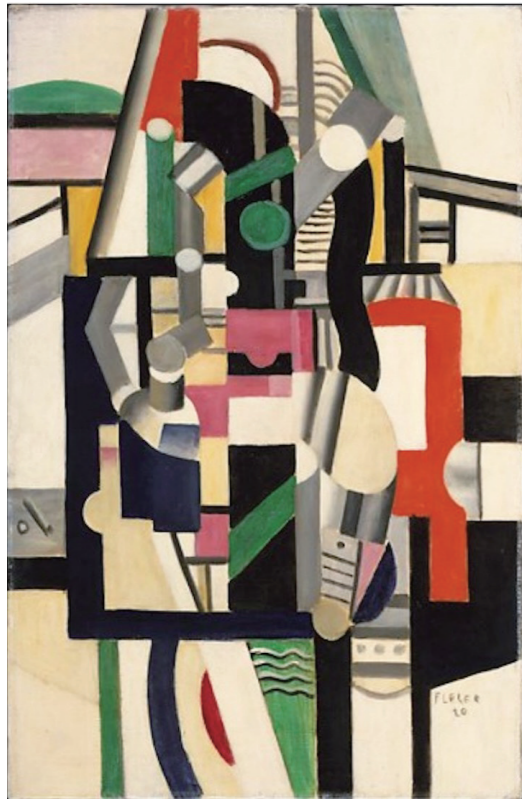
8. 费尔南多·莱热,《机械元素》,布面油画,92.1×59.7cm,1920,大都会美术馆收藏