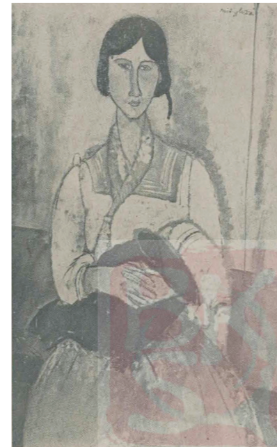
6. 莫迪里阿尼，《母与子》，刊登于1932年《艺术旬刊》