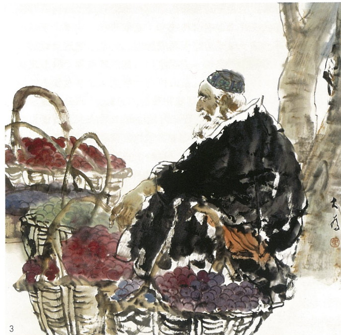
1、黄河船夫 油画 段正渠 2、明天·多云转晴 油画 忻东旺 3、维族老人 纸本水墨设色中国画 刘大为

密关联，“我”不能与社会现世脱离……所以，描绘农民实际上是思考中国当代最敏感和最迫切的问题。农民形象，作为中国人形象谱系中的最重要的一支，继续发挥着富有时代特征和人文精神的传统。这时期的农民形象和过去的相比，观念的强调大于形式的创造。而在绘画语言上，具象和表现手法居主流地位。油画以写实形态为主，水墨画以表现形态为主。这既是描绘具体人物形象的要求，也与具象和表现更容易传达画家的观念有关。