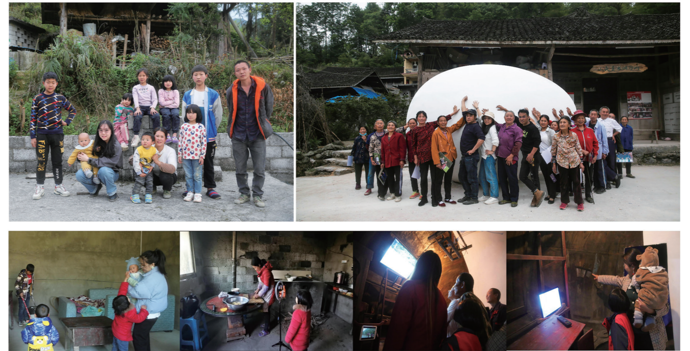
2. 李佳璐，《一个与八个》，综合材料，2022