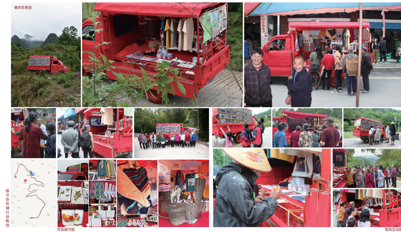
3. 向伟君,《相守图谱》, 综合材料, 2022