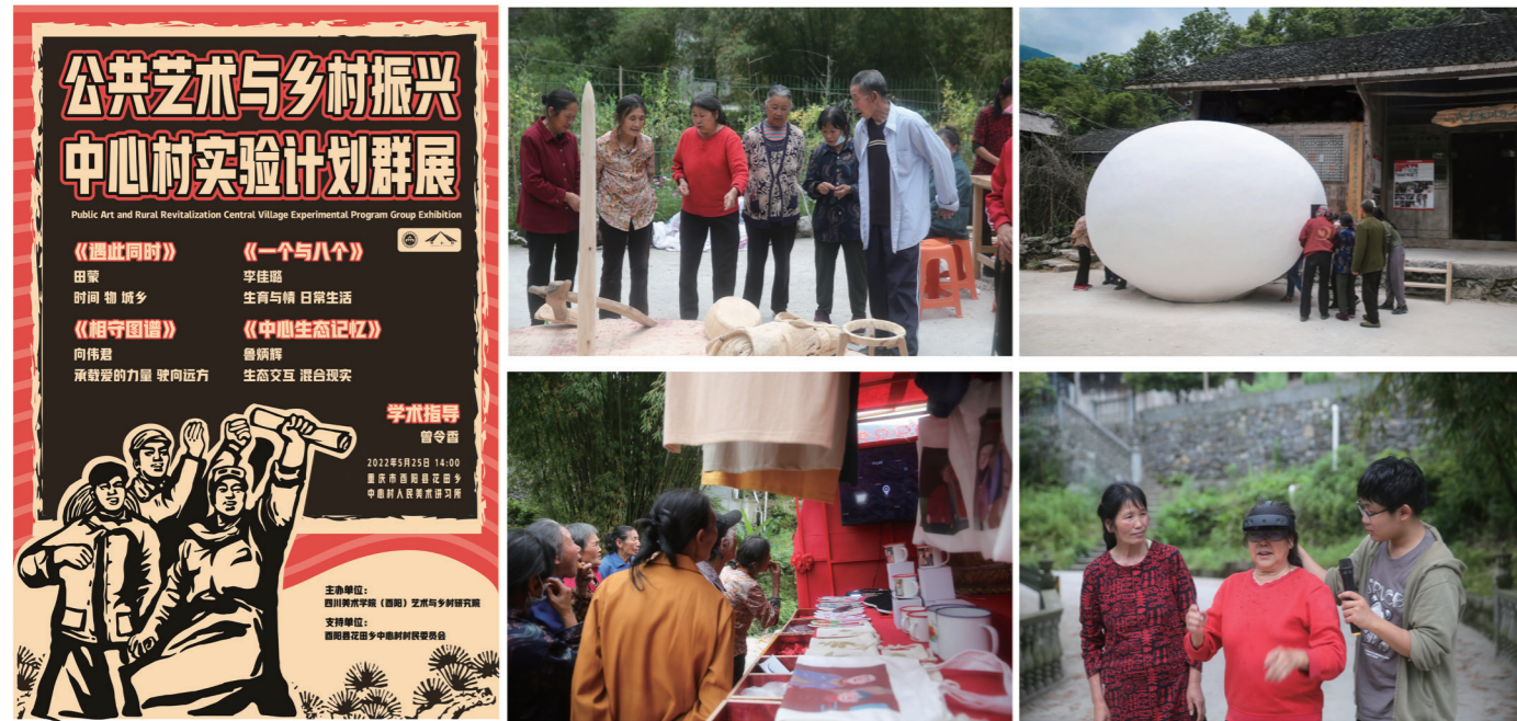
1. 公共艺术与乡村振兴中心村试验计划群展海报及现场，2022年5月22日