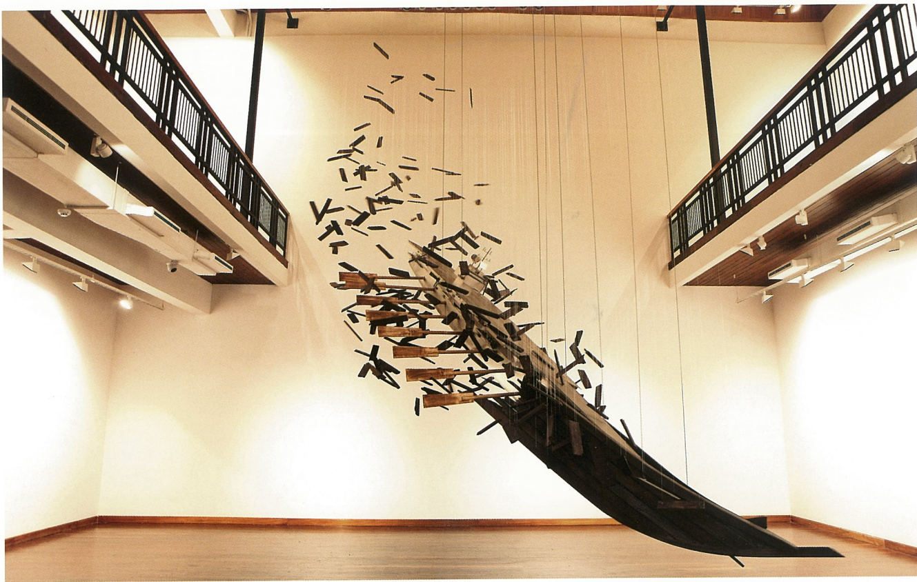
蜕变 综合材料 李晖