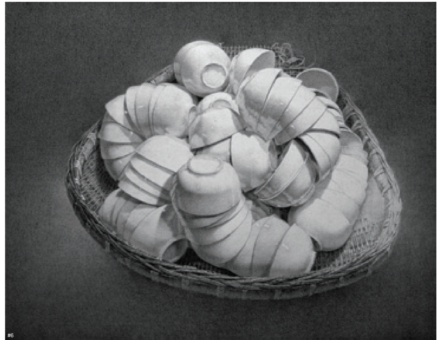
6 王培永 氩 布面综合绘画 200cm × 160cm 2018 “首届重庆油画双年展”优秀作品奖

王：四川美术学院的教学比较注重对学生创作的支持，鼓励自由创作以及实验性的绘画创作尝试。因此，我们每一届毕业生的创作主题都是非常多元的，往往每一位青年艺术家都有自己的创作方向和角度。他们的创作从侧面反映了整个社会的现象和问题，具有一定代表性。所以说，此次“油画双年展”所做的版块分区和学术梳理，本身也是为了反映今天现实社会的一些问题，或者是值得我们研究和讨论的一些话题。我们主张有自己的学术话题和问题导向，有自己的问题意识。这次展览的作品有来自四川美术学院师生的，也有来自重庆其他兄弟院校的，还有自由艺术家。我