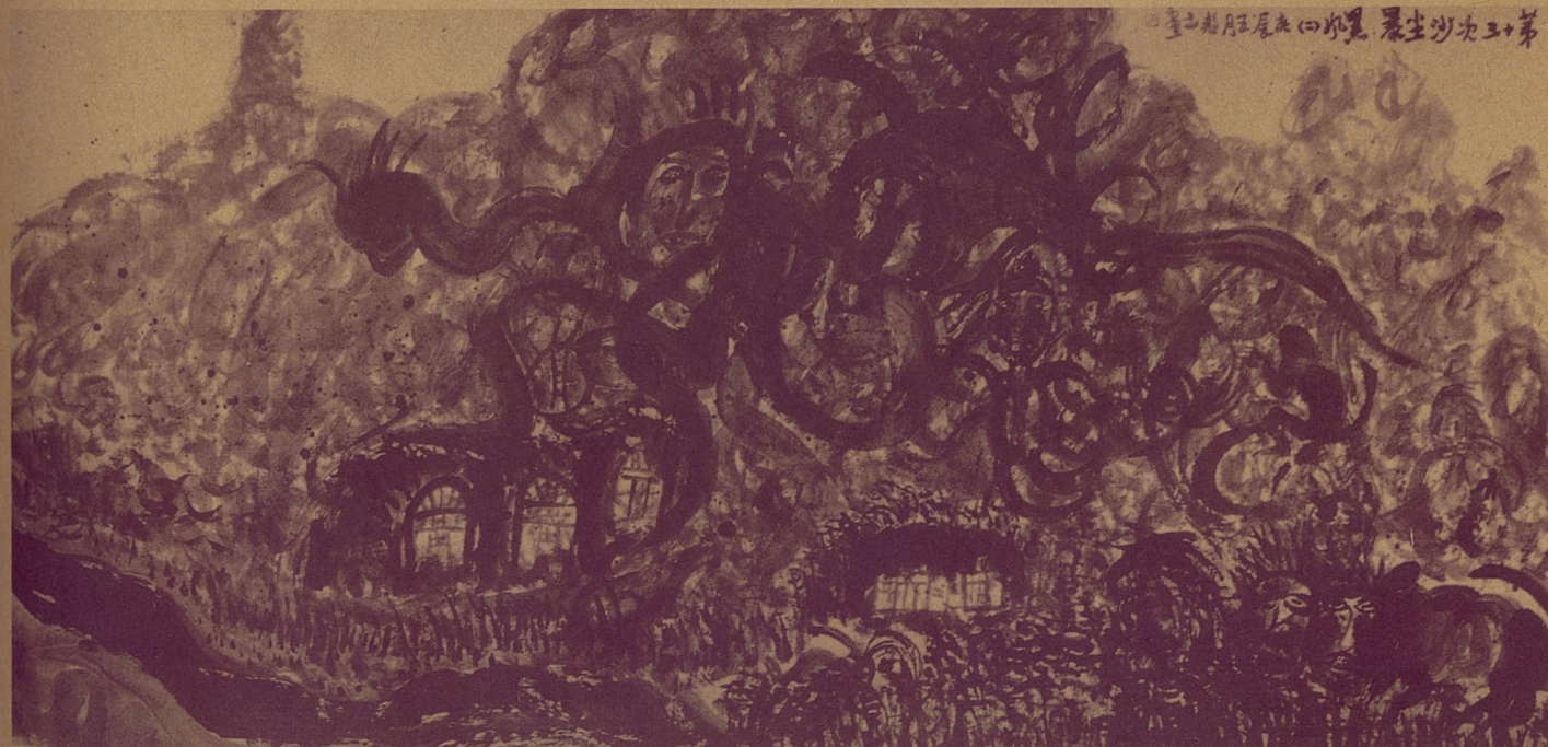
第十三次沙尘暴 杨兴文 水墨

未闻，只此一家。不要说中国军界，就是整个中国画坛，包括关注人类生存问题的前卫艺术界，在沙尘暴肆虐中国的数年间，居然没有一个人涉足这个题材。这正是我对这位场长的艺术表示敬意的原因。