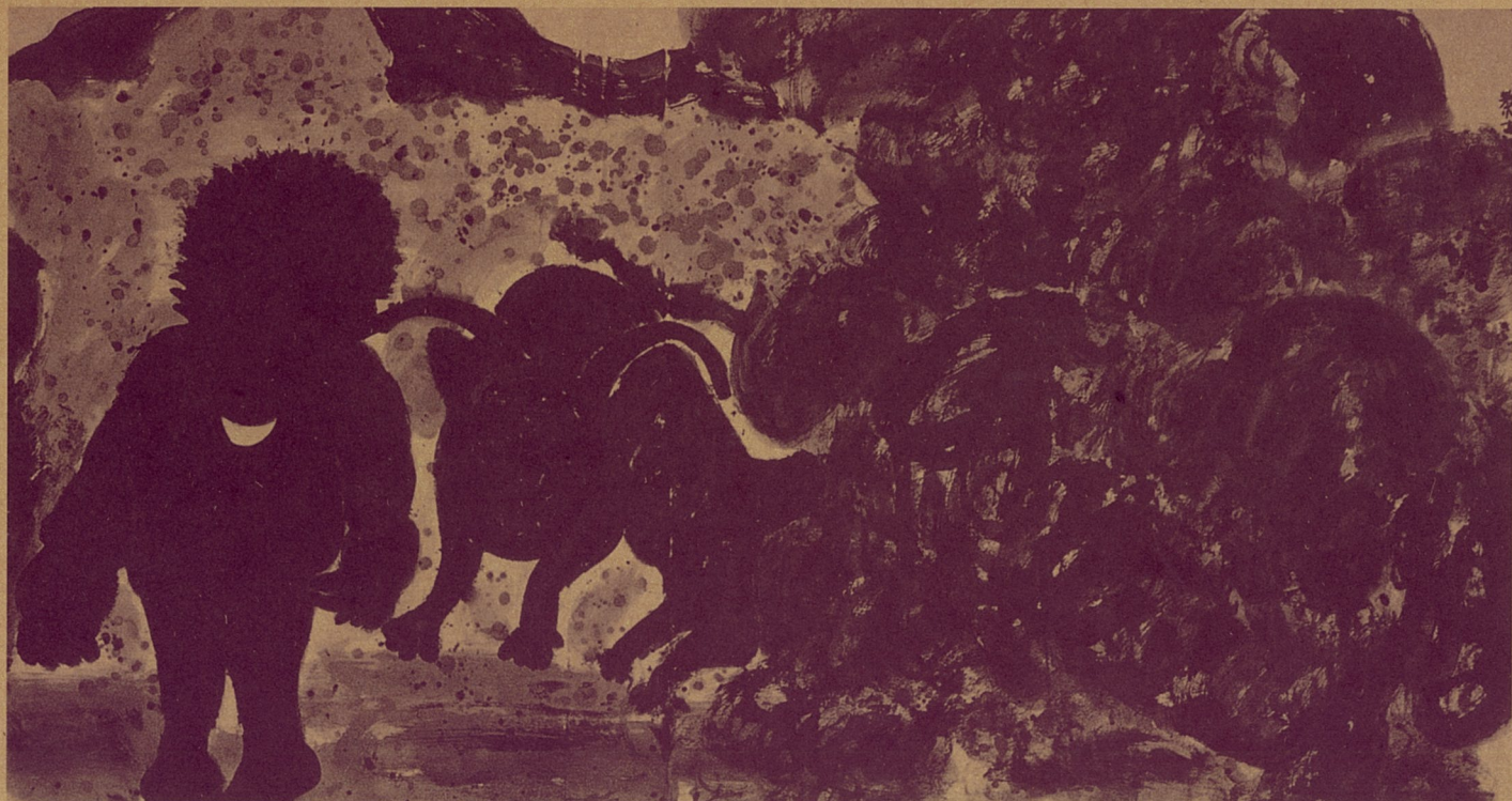
龙卷风 杨兴文 水墨

农场境内的公路两边的空地植树，做为挡风的屏障。不幸的是他发现自己无权支配这些空地，而有支配权的地方官员又不感兴趣。官员在各地做官，几年一换。这有利于防止腐败，但却助长了短期行为。人们只注重当年生效、立竿见影的工程，而植树工程不等树苗长高，领导就要改换门庭；将来的子孙受益与否，同政绩和升迁有何干系？三千年来，官