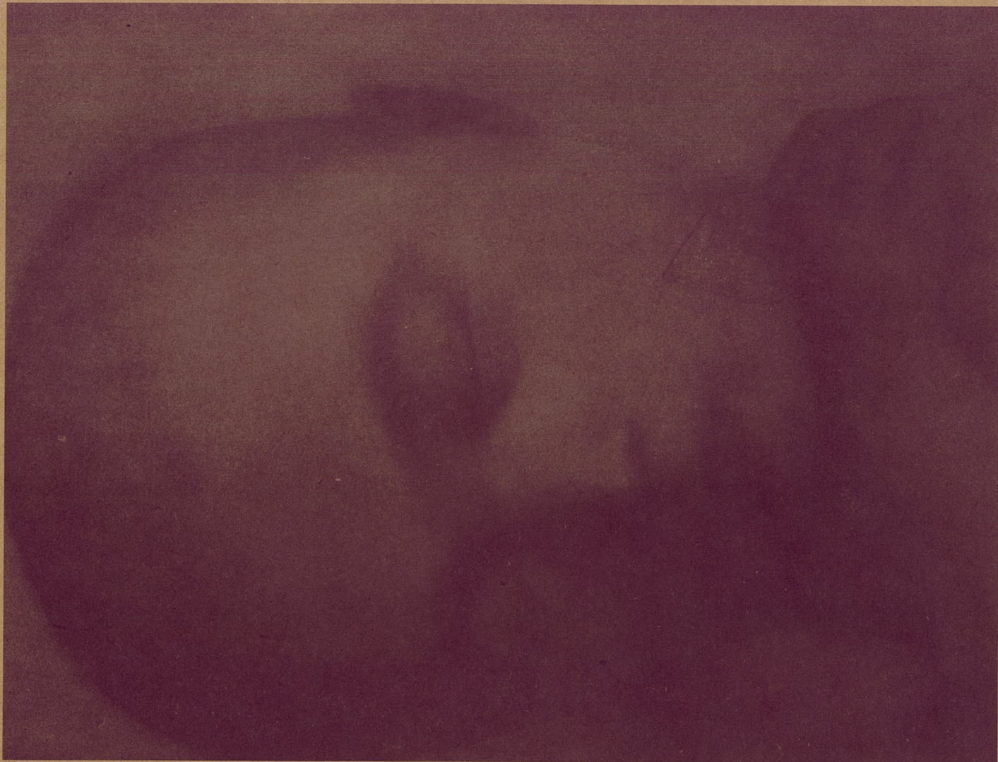
2001.No.7 张晓刚 布上油画