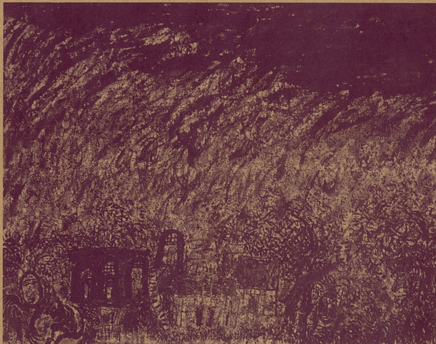
沙尘暴系列(一) 杨兴文 水墨

尘暴的影响。在美国的夏威夷，地表覆盖着一层来历不明的黄土，经考证是中国沙尘暴在千百年间东播的结果。沙尘暴形成于生态环境的失衡，直接原因除了干旱和虫灾，主要是战争与无度的开发等人类活动。数千万年前，新疆的大沙漠曾是一片森林，至今仍有大量直径1米左右的树干化石。在周代，这一带变成了草原。周穆王西游列国，到达西王母管辖的地区。据《穆天子传》记载，途中没有关于沙漠的描述，更不要说沙尘暴了。秦始皇营造连绵几百里的阿房宫，将陕西和川北一带的森林砍光。唐太宗临死前，指示大臣将自己葬在九宗山。那座金字塔形的山，距长安约60公里，当时举目可见。而今即使在大晴天，也很难看清6公里外的山峦。20世纪30年代，陕北一带的森林，由于大规模垦殖和烧炭，已经变成荒漠化的干旱地区。中国人爱吃的野生发菜，产在宁夏一带。为了满足嘴巴的恶习，近几年来，宁夏一带的沙漠化速度令人触目惊心。每到春夏之交，沙尘暴横亘大西北。杨兴文爱水