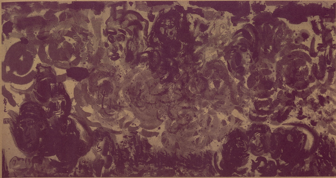
第十二次沙尘暴 杨兴文 水墨

随着经济的快速发展，世界已处在全球化的过程中。处于经济秩序主动与霸权地位的西方为了建立新的适合发展的新秩序，主动提出多元文化的理论，作为在20世纪一直处在边缘，同时是不断被改造的我们的文化，今天似乎有了其相对的意义，在思考全球化进程时，地区性差异变成了其中重要的组成部分。关键在于我们应该以什么立场来看待这些变化：是从多元化的状态来强调我们一元的相对性?还是从多元化发生的原由来看待一体性与差异性的问题及我们在其中处于什么样的位置及我们所可能采取的行动。目前对于语境的关注要远甚于先前对于宏伟理论的要求，今天文化已清楚地表明它依据政治与经济力量并在其中被建构的性质，我们将赋予它何种意义以及它将带有何种政治意义都将取决于语境以及偶然性而定，而非理论的立场。