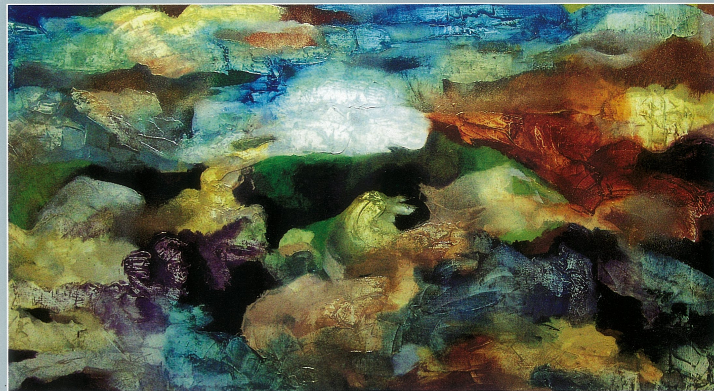
气象之十二 油画 傅榆翔