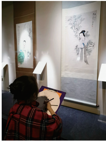
2. “三千大千——张大千抗战时期绘画作品展”（2019年），重庆中国三峡博物馆展览现场，观展者艺术临习

移动设备中，为受时间和距离所限制的观众提供了便利。同时，美术馆也通过线上展览等数字化模式得到了更多的推广和关注。以2020年5月22日开幕的中央美术学院线上毕业展为例，仅仅四天，这场史无前例的毕业展就已有300万人次浏览，访问覆盖110多个国家和地区；2021年四川美术学院的线上毕业展也突破了380万的浏览量，较上一年增加了约30万浏览量。而线下的毕业展美术馆每日预约量仅800个名额；由此，美术馆开展数字化公教活动的影响力与传播力在近两年得到了大幅度的提升，艺术创作与艺术观念以数字化形式走入了更多人的视野中。