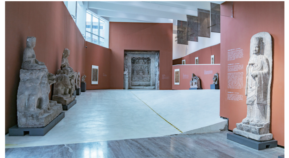
3. “盛世修典——‘中国历代绘画大系’阶段性成果展”（2021年9月28日至11月28日），四川美术学院美术馆展览现场

其次，“线上+线下”双线协同发展能够帮助各大美术馆节约成本，缩减开支；美术馆等主体可将非必要的内容移至线上进行呈现，节约空间及物料。在开展线下公教活动时，可广泛采用线上同步直播，这样既能防止大规模的人员聚集，亦可避免因此产