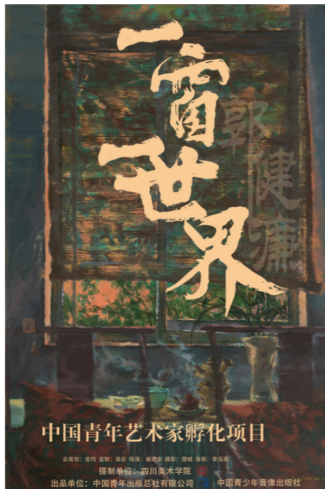
7. 《一窗世界——郭健廉》，纪录片海报