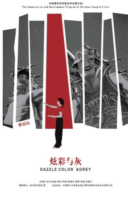
3. 《熊莉钧：炫彩与灰》，纪录片海报