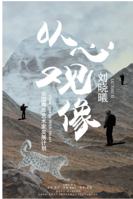
2. 《以心观像——刘晓曦》，纪录片海报