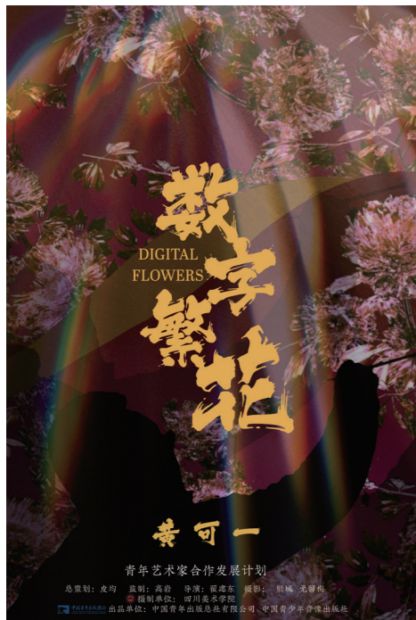
6. 《数字繁花——黄可一》，纪录片海报