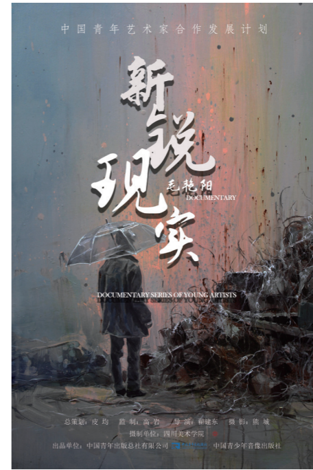
4.《毛艳阳：新锐·现实》，纪录片海报