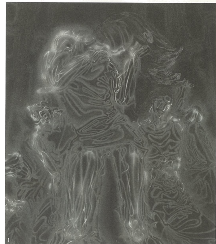
1. 我 丙烯 徐欣

庞茂琨 :长期从事基础教学的人应该都有这样的一种体会,即基础教学大凡是在一种老生常谈、枯燥乏味的循环往复中进行的,这是因为任何一门学问和技能的学习都离不开由浅入深、由简到繁的过程。何况艺术特别是造型艺术实践性和手工性较强,所有的艺术观念、创造意识和审美能力都是在这种由低级到高层次的长期磨练中才能逐步建立。所以基础教学应该也必须是把艺术教育中最基本的、最初级的内容对学生进行传授,其中包括传统美术知识、造型基础能力、基本审美能力的培养,而这些内容对于教师本人来说都不具有较强的挑战性和实验性,而且在长期的重复中,容易造成教师在教学意识和方法