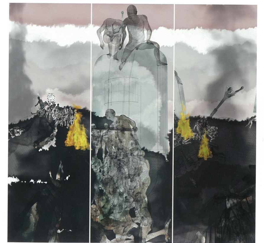
#1 飘 创作草图 缪晓春 #2 火 创作草图 缪晓春

人生如棋，变幻不定。人为棋子，冥冥中为某种力量推移，身不由己。无论输赢，只走一盘，下完便完，不可重来也不可悔棋。