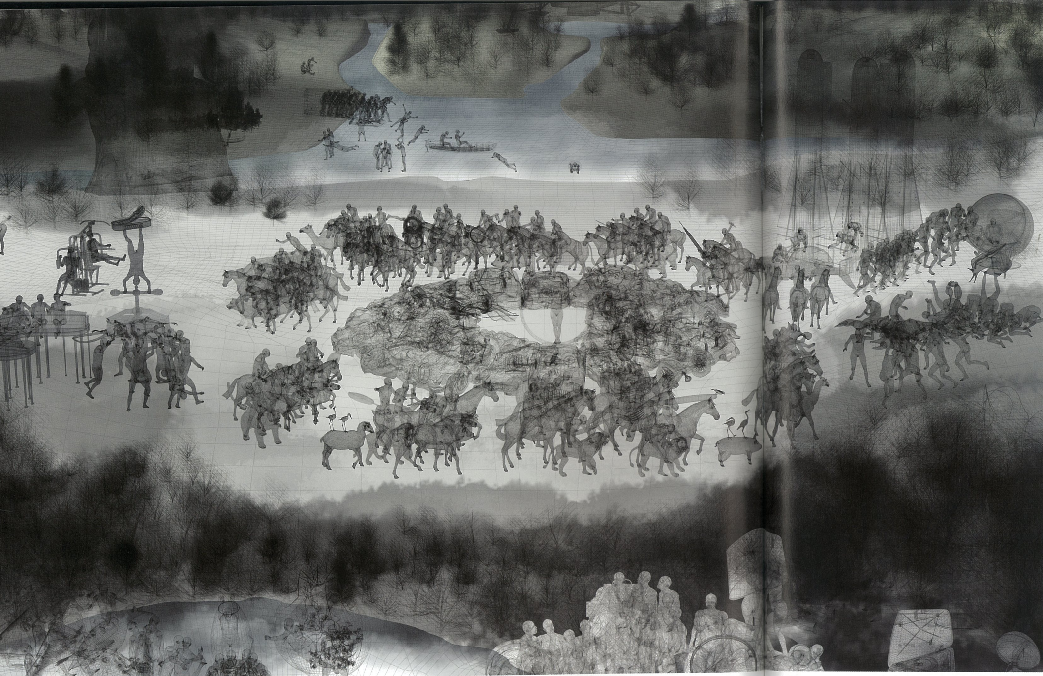
坐天观井（局部） 创作草图 缪晓春